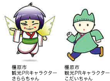
橿原市 観光PRキャラクター さらちゃん

橿原市は、奈良県のほぼ中央に位置し、万葉の時代を偲ばせる大和三山がそびえ、その中央には約1300年前にわが国初の首都であった藤原宮跡があります。また、江戸時代の面影を残す今井町、多くの参拝者が訪れる橿原神宮など市内には歴史的文化遺産や観光スポットが点在しています。