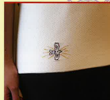
ならまき めっちゃ薄い腹巻き(金鶏)