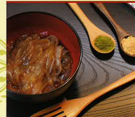
スイーツこんにやくくずきり風