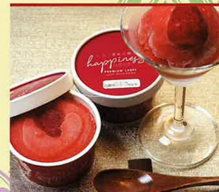
はびねす 苺農家の自家製ジェラート プレミアム古都華シャーベット