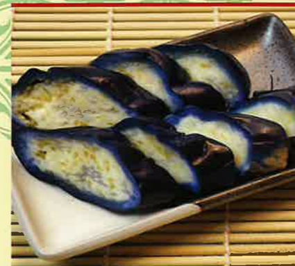
十返舎こたわりなすの漬物